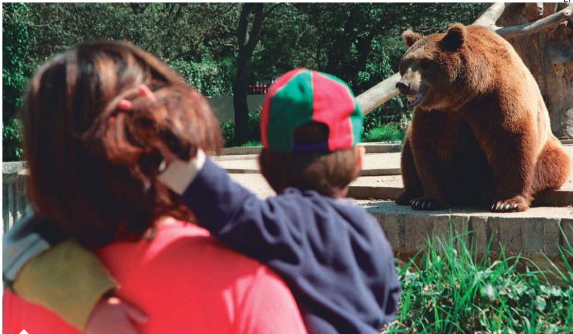
Viajar con niños siempre debe ser un llamado de atención.

Según estadísticas de la empresa de asistencia al viajero Assist Card, la mayor cantidad de consultas que generan los chicos en los viajes al exterior tienen que ver con síntomas "simples" como fiebre, debilidad general, dolor de panza o de cabeza, descompostura o traumatismos leves. Las ciudades con mayor índice