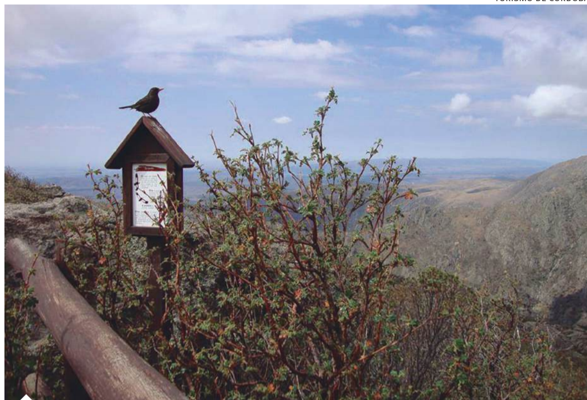
Más de 400 especies constituyen un importante atractivo provincial.

Por su parte, en la Reserva de Usos Múltiples Bañados del Río Dulce y Laguna Mar Chiquita se encuentran las tres especies de flamencos de Argentina: el "Flamenco austral", el "Parina grande" y el "Flamenco de James". Además, se pueden observar varias especies de