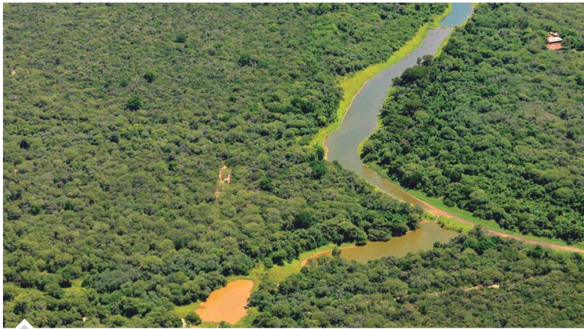
Una vista aérea que refleja la naturaleza de El Impenetrable.

El parque nacional ocupa unas 130 mil hectáreas. También abarca zonas de Formosa, Salta y Santiago del Estero en las que viven unas 60 mil personas.