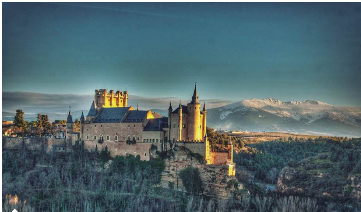
El Alcázar de Segovia, cuya primera piedra se colocó en 1122.

Ubicado al este de Sussex, en Inglaterra, es una de las construcciones medievales que mejor refleja el esplendor de esa época en Reino Unido. Este impresionante y hermo-