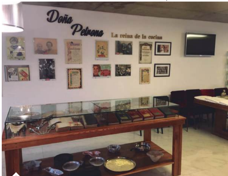
Algunas de las reliquias que pueden encontrarse en el museo.

Distintas ediciones, que dan cuenta de tanto uso, se pueden ver en el Museo junto a los enseres y distintos objetos testimonios de más de 50 años de labor.