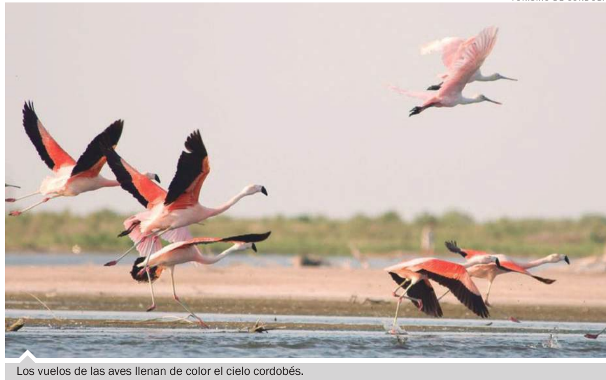
Los vuelos de las aves llenan de color el cielo cordobés.