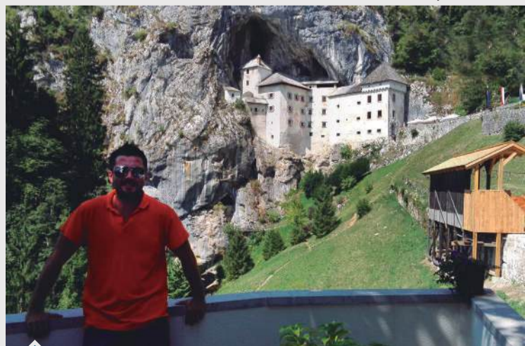
Maschio en el increíble Castillo de Predjama.

me tocó de sensación térmica fue 31 grados bajo cero.