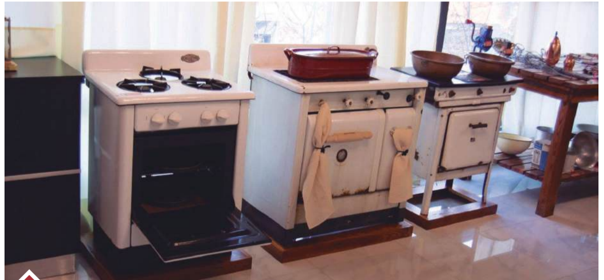
Las clásicas cocinas que supieron ser la esencia de Doña Petrona.

De la mano de la radio se hizo conocida mientras llenaba teatros enseñando el mundo de las cocinas a gas y en 1931 comenzó a publicar sus recetas en la revista "El Hogar", donde firmaban relatos escritores como Jorge L. Borges, Roberto Arlt y Horacio Quiroga, entre otros.