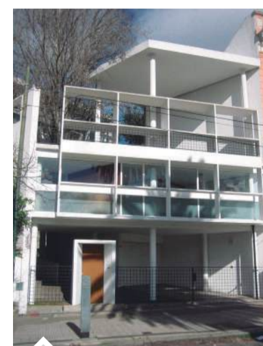
La Casa Curutchet, frente al bosque.

El trayecto contempla diez paradas. Partirá desde el Palacio Campodónico (55 entre 5 y 6); y parando en la Casa Curutchet (54 entre 1 y 2); el Circuito del Bosque; el centro comercial a cielo abierto de 4 y 51; el Centro Cultural Pasaje Dardo Rocha (50 entre 6 y 7); el Teatro Argentino (9 entre 50 y 51); el Teatro Coliseo Podestá (10 entre 46 y 47); el Centro Cultural Islas Malvinas (50 entre 19 y 20); la Catedral (14 entre 51 y 53); y el Palacio Municipal (12 entre 51 y 53). El Bus Turístico Municipal, que cuenta con capacidad para 41 pasajeros, baño, sistema de audio exterior y una guía turística, es