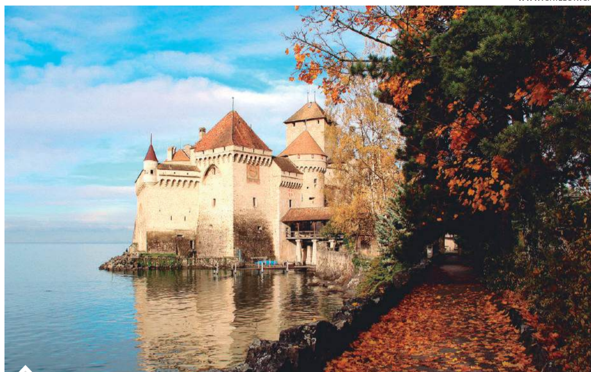
El castillo de Chillon está a orillas del lago de Ginebra, en Suiza.

Y aunque Alemania tiene muchas de estas construcciones para conocer, también hay que hacerse un espacio para el Castillo de Lichtenstein, uno de los muchos palacios de la nobleza de Baden-Württemberg que pueblan los Alpes Suabos. De estilo neogótico e inspirado por la novela "Lichten-